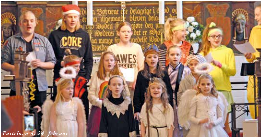
Fastelavn d. 24. februar