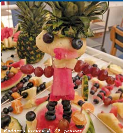
Rodder i kirken d. 29. januar