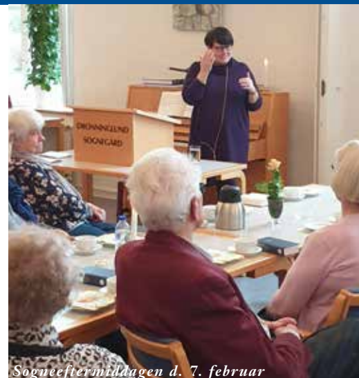
Sogneeftermiddagen d. 7. februar