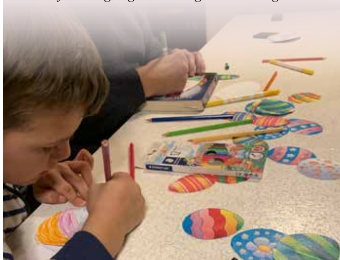
Juniorcoret maler påskeæg til beboerne i Blåbærhaven.