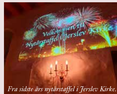
Fra sidste års nytårsstaffel i Ferslev Kirke.

OBS: Arrangementet kan blive aflyst eller flyttet, så hold øje med provstiets hjemmeside.