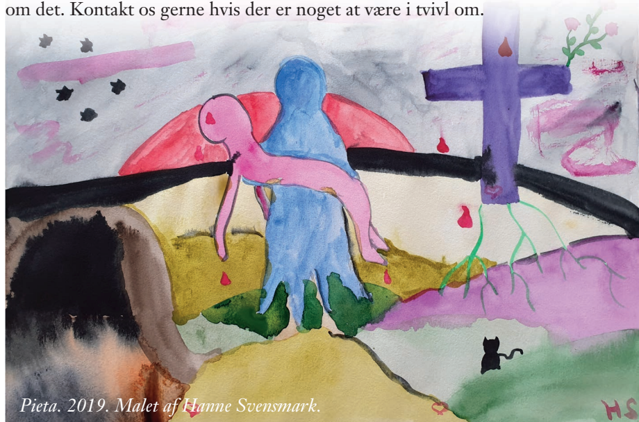
Pieta. 2019. Malet af Hanne Svensmark.

Vi må kun sende brev til medlemmer af Folkekirken, medmindre vi bliver bedt om det. Kontakt os gerne hvis der er noget at være i tvivl om.