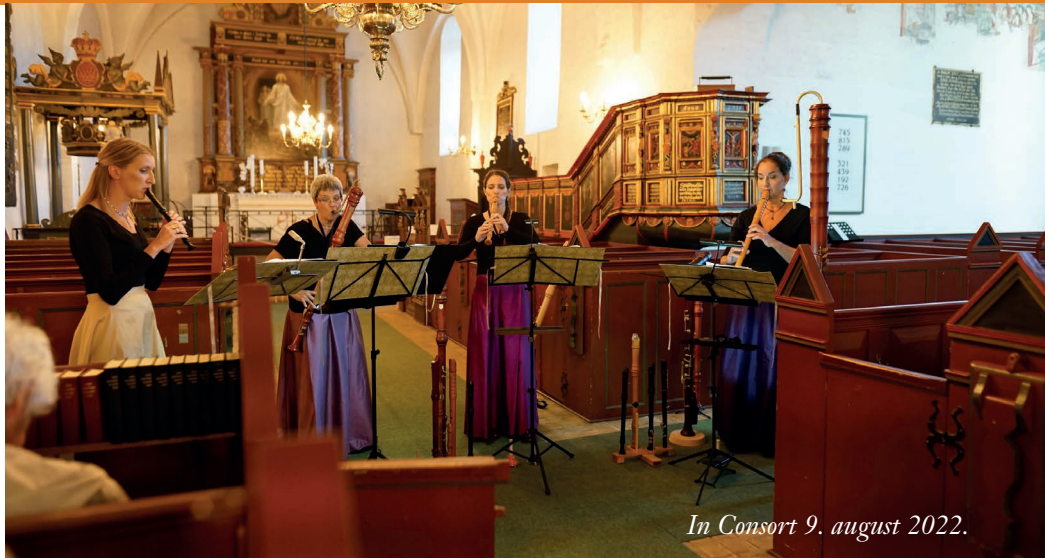
In Consort 9. august 2022.