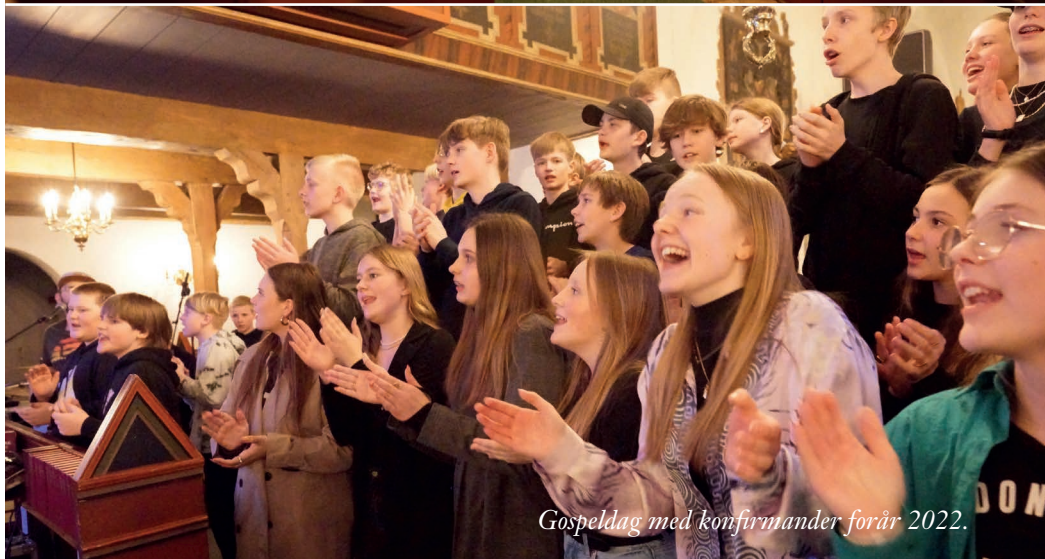
Gospeldag med konfirmander forår 2022.